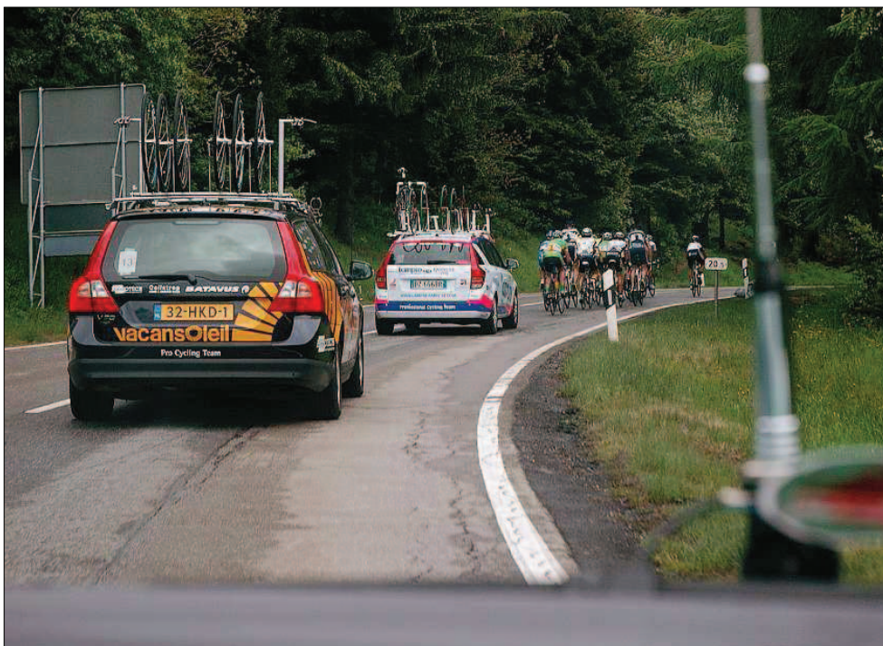
Blick aus dem Begleitfahrzeug: Eine kleine Gruppe kann dem Hauptfeld am Berg nicht mehr folgen und fällt zurück. Mit dabei auch Daniel Schorn, die Sprinthoffnung des Teams NetApp.

In der Unterkunft herrscht mittlerweile rege Betriebsamkeit. Am Buffet stärken sich die Fahrer mit Kuchen und Weißbrot. Aus Zimmer 14 dringen militärische Töne in die Gänge des schmucken Landhauses: „Dimitri, im Laufschrift, marsch, marsch!“ Eule ruft zum